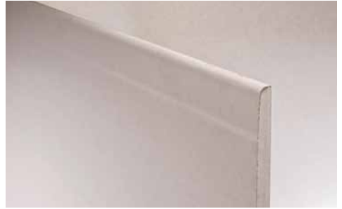
Feuerschutzplatte LaFlamm dB